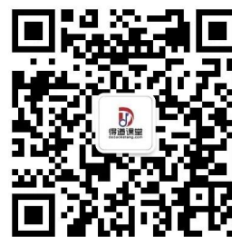
得道课堂（技术支持） 公众号